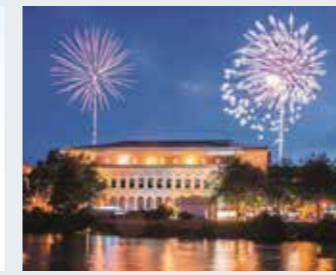
Feuerwerk an der Stadthalle